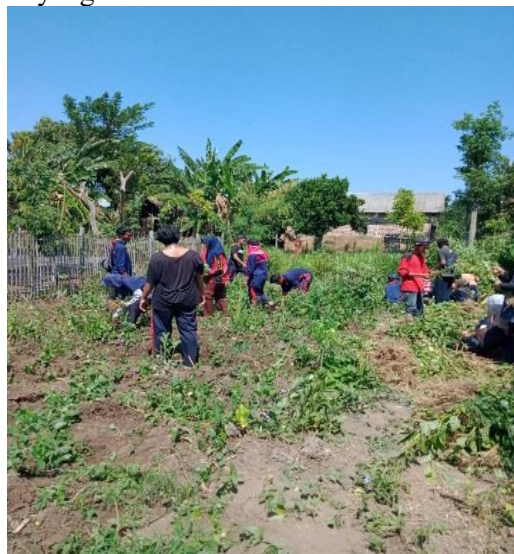
Gambar 3.1 Persiapan Lahan

Persiapan lahan merupakan langkah awal untuk memulai budidaya, pemilihan lahan yang tepat dapat mendukung pertumbuhan sayur yang akan kita tanam nanti karena mendapat cahaya yang cukup untuk memaksimalkan pertumbuhan. Langkah awal persiapan lahan yang harus dilakukan adalah melakukan penyiangan kesemua gulma-gulma atau tanaman yang dianggap mengganggu terhadap sayur yang akan kita tanam.