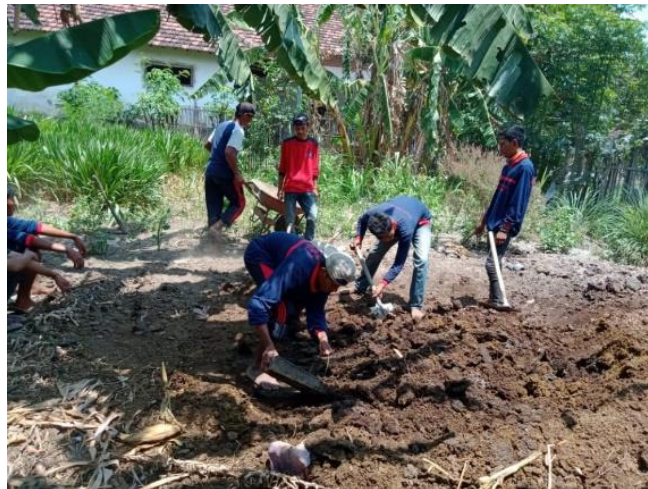
Gambar 3.2 Persiapan Media Tanam