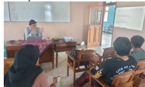
Kegiatan presentasi hasil kegiatan dengan masyarakat