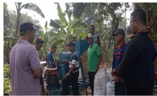
Kegiatan Proses Pembuatan Pupuk Bokashi