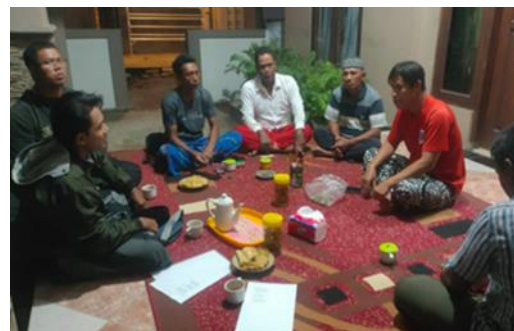
Kegiatan musyawarah dengan masyarakat