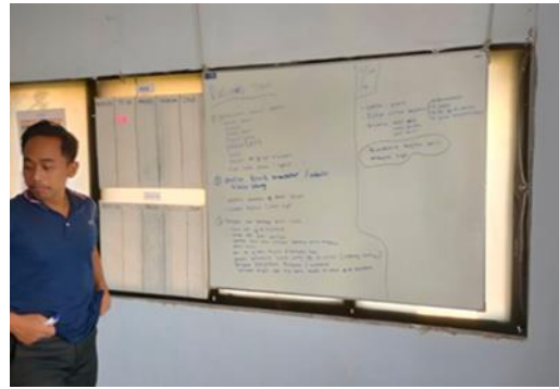
Kegiatan musyawarah sebelum terjun di lapangan