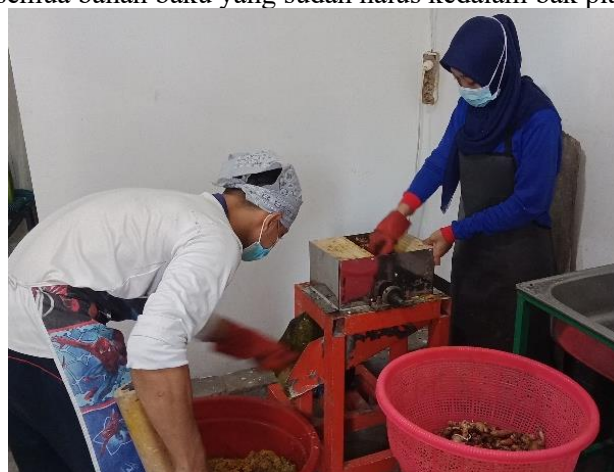
Gambar Penghalusan Bahan Baku