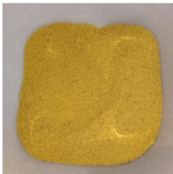
Gambar Inspeksi Hasil Pengkristalan