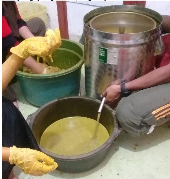
Gambar Proses Pemasaran