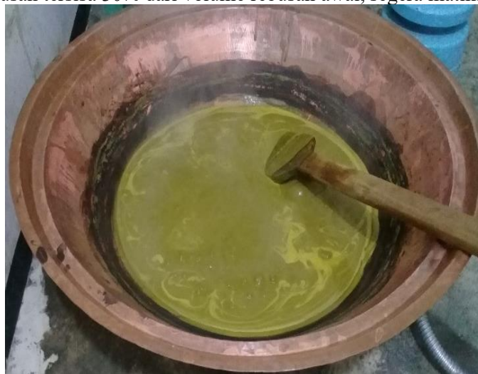
Gambar Proses Perebusan