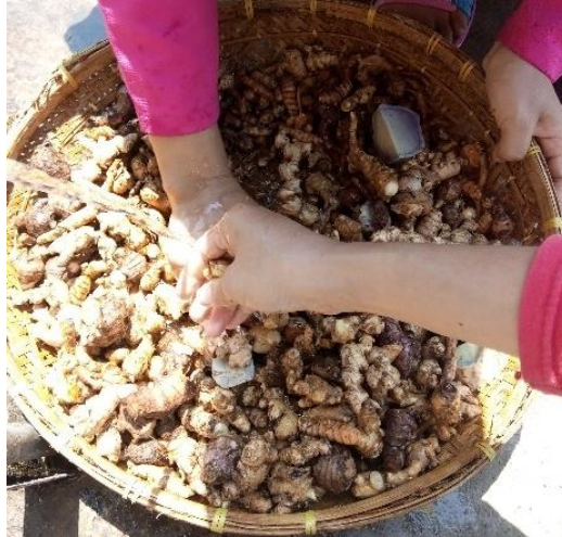
Gambar Pencucian Empon-Empon