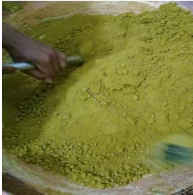
Gambar Pengkristalan Produk Akar Tanjung