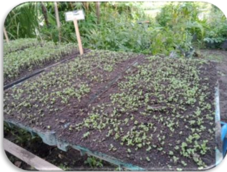
Gambar Benih Selada