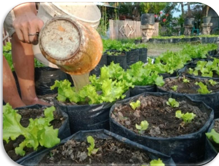
Gambar Pemeliharaan Selada

Penanaman selada dilakukan ketika media sudah siap dengan umur bibit sekitar 10-12 hari setelah semai. Proses penanaman ini dilakukan dengan penyiraman polybag terlebih dahulu untuk memastikan media dalam polybag tidak kering, kemudian beri 4 lubang dalam polybag untuk masing-masing benih selada agar masa pertumbuhannya lebih efektif, kemudian disiram kembali dengan air yang mengalir sedikit-sedikit. Pemeliharaan Perawatan tanaman dilakukan dengan penyiraman dua kali sehari saat tidak ada hujan hingga masa panen, serta dilengkapi dengan perawatan lainnya. Pemberian pupuk dilakukan dengan 1 minggu setelah tanam dan 3 hari sekali selama perawatan tanam. Pemberian pupuk menggunakan pupuk cair organik limbah rumah tangga yang di campur dengan manutta gold dengan dosis 1 gayung limbah rumah tangga dan 13 tutup manutta per 20 liter air dalam timba. Pemeliharaan selada ini dilakukan dengan di pupuk minimal 1 minggu sekali.