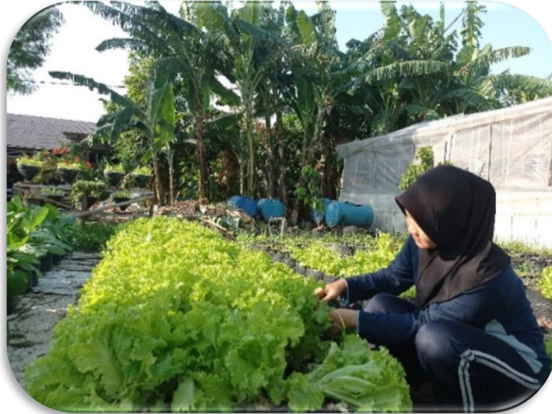
Gambar Panen Selada

Panen selada dilakukan saat pertumbuhan optimal, yaitu sekitar 21 hari setelah pindah ke polybag besar atau 42 hari sejak penanaman dari biji. Rata-rata berat segar tanaman selada sekitar 65 gram per tanaman atau per polybag. Menurut Wardhana et al., 2016 Selada umumnya dipanen pada umur 35–42 hari setelah tanam, ditandai daun bawah menyentuh tanah. Panen dilakukan dengan mencabut tanaman, membersihkan akar dari tanah, lalu dikemas secara higienis.