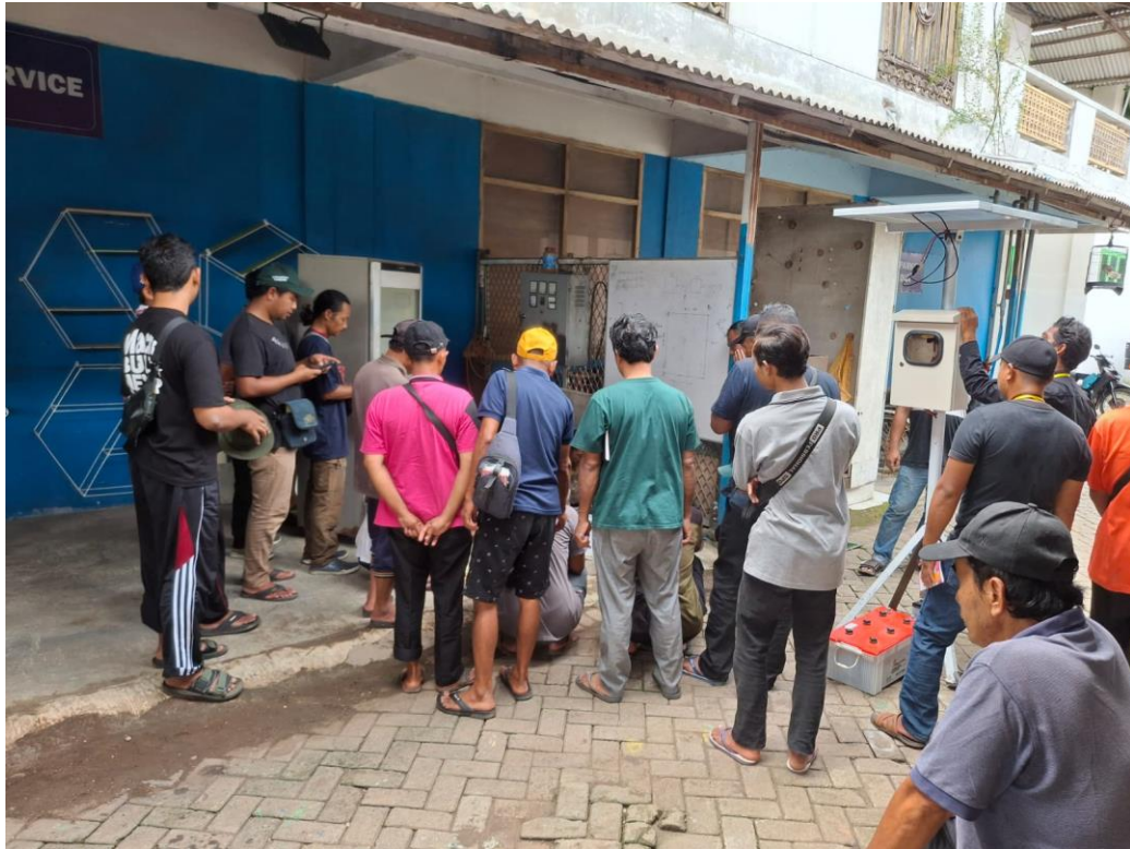
Gambar 3.1 pelaksanaan perakitan solar panel

Selain peningkatan pemahaman teoritis, kegiatan pelatihan ini juga memberikan pengalaman praktis kepada peserta dalam merakit panel surya sederhana. Pada tahap praktik, peserta dibagi menjadi beberapa kelompok kecil untuk melakukan perakitan panel surya secara langsung dengan pendampingan dari tim pengabdian. Kegiatan praktik meliputi proses penyusunan sel surya pada papan panel, penyolderan kawat penghubung antar sel, pemasangan kabel keluaran, serta pengujian tegangan listrik menggunakan multimeter.