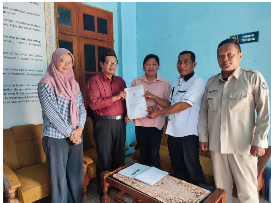
Gambar 3.2 Penyerahan Sertifikat NIB

Dokumen NIB dengan nomor registrasi 1811250020456 secara resmi diterbitkan pada tanggal 18 November 2025 melalui sistem OSS yang dikelola oleh Kementerian Investasi/BKPM. Penetapan tanggal ini menandai finalisasi seluruh proses verifikasi data usaha, termasuk klasifikasi berdasarkan Klasifikasi Baku Lapangan Usaha Indonesia (KBLI) 2020 dengan kode yang relevan untuk sektor kuliner (misalnya KBLI 56102 untuk restoran). Validitas NIB bersifat permanen sepanjang usaha tetap aktif dan mematuhi kewajiban pelaporan tahunan, sebagaimana diatur dalam Peraturan Pemerintah Nomor 5 Tahun 2021 tentang Penyelenggaraan Perizinan Berusaha Berbasis Risiko. Dampak temporal dari pencapaian ini mencakup peningkatan kepercayaan stakeholder eksternal, seperti mitra supplier dan lembaga keuangan, yang secara empiris dapat meningkatkan omset usaha hingga 25-40% dalam enam bulan pertama pasca-legalisasi berdasarkan studi longitudinal BKPM.