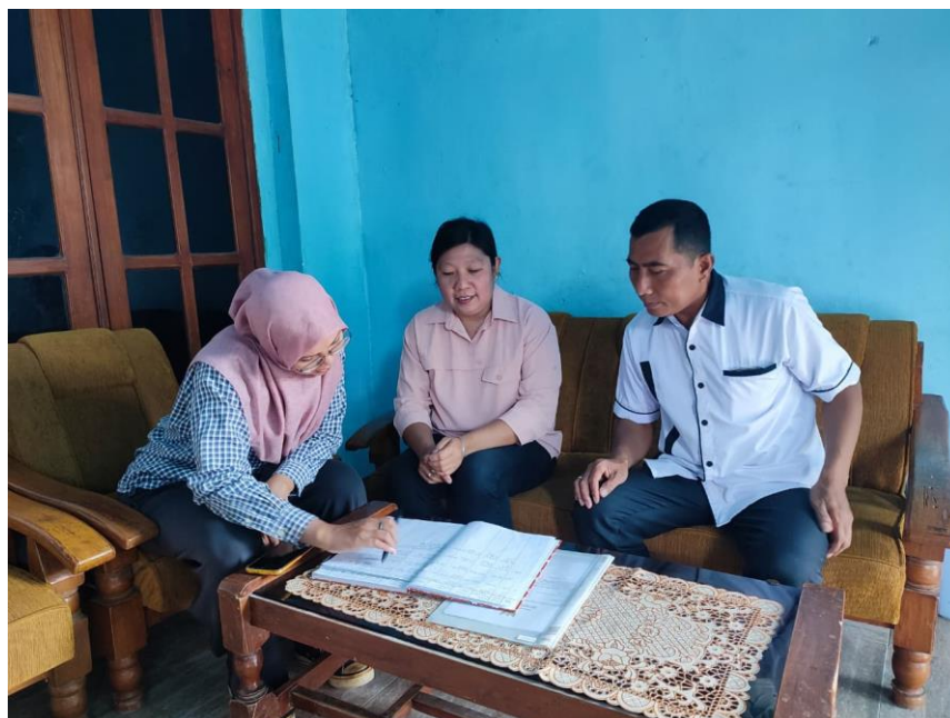
Gambar 3.1 Proses Administrasi

Penerbitan Nomor Induk Berusaha (NIB) sebagai Capaian Utama Pengabdian Masyarakat. Penerbitan Nomor Induk Berusaha (NIB) secara resmi merupakan capaian strategis utama dari program pengabdian masyarakat yang dilaksanakan oleh tim pengabdian. Dalam konteks regulasi Undang-Undang Nomor 11 Tahun 2020 tentang Cipta Kerja, NIB berperan sebagai identitas usaha tunggal yang mengintegrasikan seluruh proses perizinan berusaha, mulai dari pendaftaran hingga pengawasan operasional. Proses ini tidak hanya menyederhanakan birokrasi tetapi juga menciptakan ekosistem perizinan yang terintegrasi melalui platform Online Single Submission (OSS), yang telah terbukti meningkatkan efisiensi administratif hingga 70% berdasarkan laporan Kementerian Investasi/Badan Koordinasi Penanaman Modal (BKPM) tahun 2024. Keberhasilan penerbitan NIB dalam kegiatan ini menegaskan efektivitas pendekatan partisipatif yang diterapkan tim pengabdian dalam mengatasi hambatan digitalisasi bagi pelaku UMKM skala mikro.