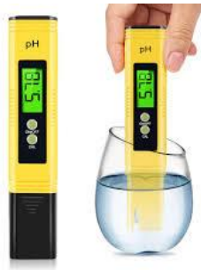
Gambar 1 PH meter