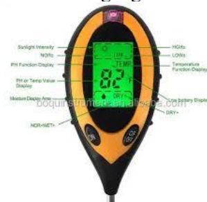
Gambar 2 Thermometer Tanah Sumber: goggle 2024